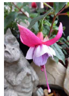
Doro und Thomas

Abfahrt: 07.00h Wintersingen, Blumatt 07.45h Würenlos, Raststätte 08.30h Zürich, Flughafen